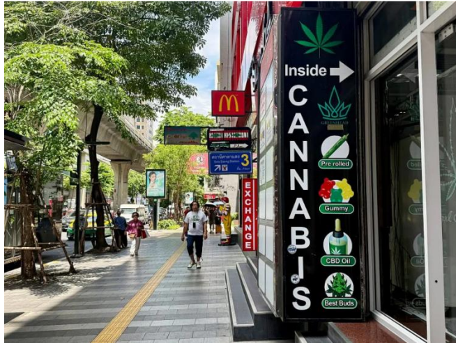
图 泰国曼谷的大麻店