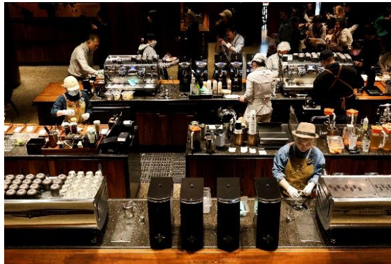
图 上海星巴克工坊咖啡师制作饮品中